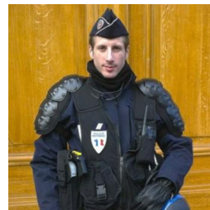
Xavier JUGELE tué le 20.04.17 à Paris