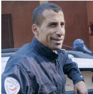
Ahmed MERABET tué le 07.01.15 à Paris