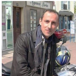
Franck BRINSOLARO tué le 07.01.15 à Paris